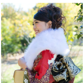
成人するお子様へ お祝いのメッセージ