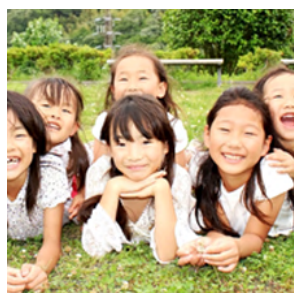
2分の1成人式で未来の 自分にメッセージ