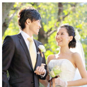
結婚式当日の気持ちを 10年後の自分たちへ