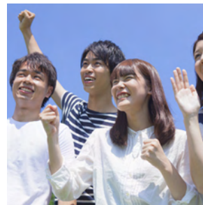
10年後の自分たちへ メッセージ