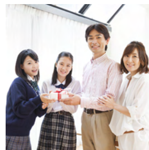
両親の結婚記念日に 感謝のメッセージ