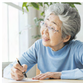
幸せな思い出を 20年後のお子様へ