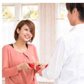
記念日に彼女へ サプライズメッセージ