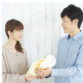
5年後の結婚記念日に 妻(夫)へのサプライズ