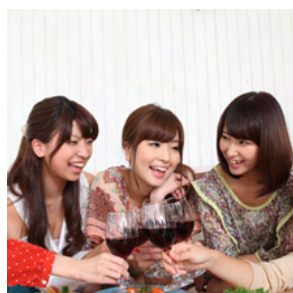
20歳の私から30歳の 自分宛てにメッセージ