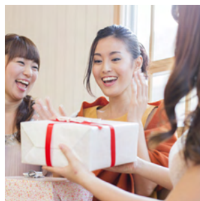
友達の誕生日に お祝いのメッセージ