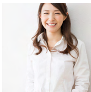
同窓会で10年後の自分へ 向けて皆でメッセージ